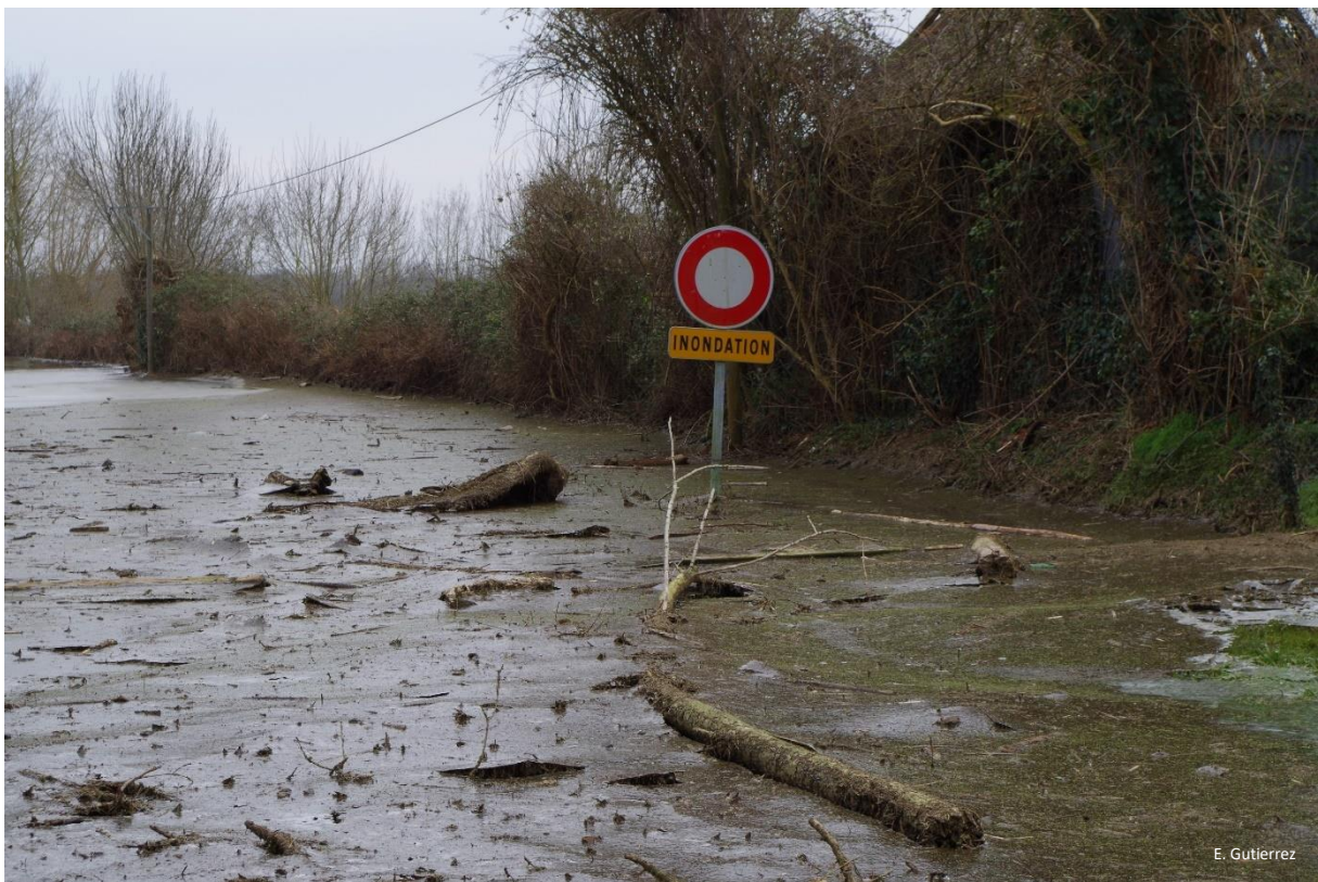
« Gel et inondation au tournant d'une route », le 11 février 2021 au lieu-dit les Marottières (Soulaire-et-Bourg)